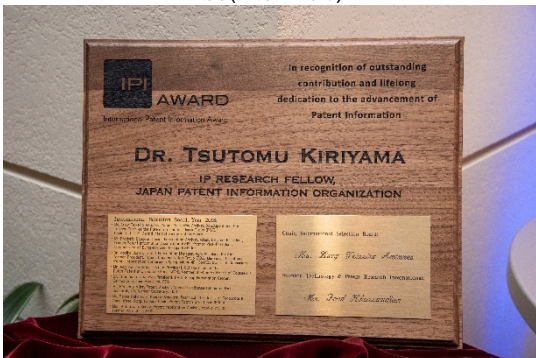
IPI-Award 2018 の盾(実物写真)