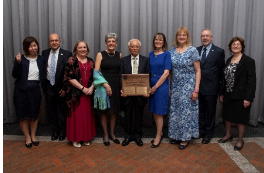
IPI-Award 選考委員と過去の受賞者 3 人と記念写真