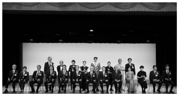
● 図2 日本クリエイション大賞2022 表彰式

「鉄筋を使わない“さびない橋”、世界で初めて高速道路で実用化」 西日本高速道路株式会社（大阪府大阪市） 三井住友建設株式会社（東京都中央区）