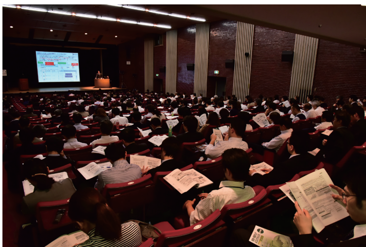
コンファレンスの様子

た。11月4日から3日間の会期中には、13のセッションからなるコンファレンスを科学技術館の地下サイエンスホールで開催いたしました。