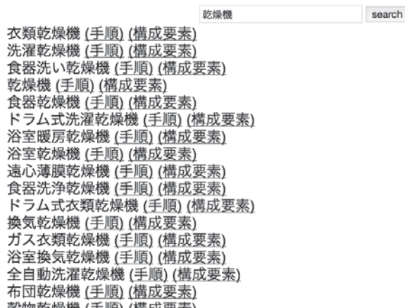
図4 システム動作例1