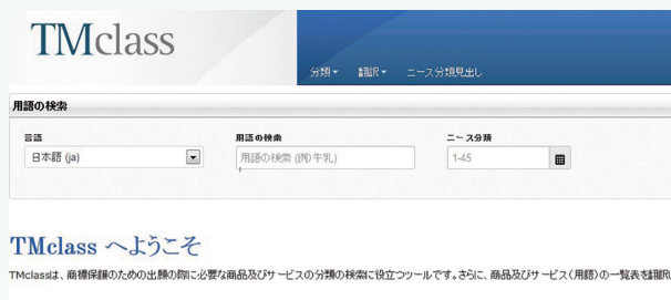
図2 TM クラスのウェブサイトの掲載ページ ( http://TMclass.TMdn.org/ec2/ )

「TM クラス」とは、OHIM の開発した EU 域内の各商標庁において認められる商品・役務表示を一括して検索照会することができるツールであり、タクソノミーとは、この TM クラス内に蓄積されている商品・役務表示を階層構造化して表示しようとする試みである。本プロジェクトは、OHIM が EU 域外の官庁の TM クラス及びタクソノミーへの参画を促すことを目的として提案し、2012 年に TM5 のプロジェクトとなった。JPO は、我が国及び海外ユーザーの利便性向上に資するべく 2012 年 10 月に TM クラスへの参画を表明し、TM クラスに蓄積するための商品・役務表示データの提供等の協力を行っている。