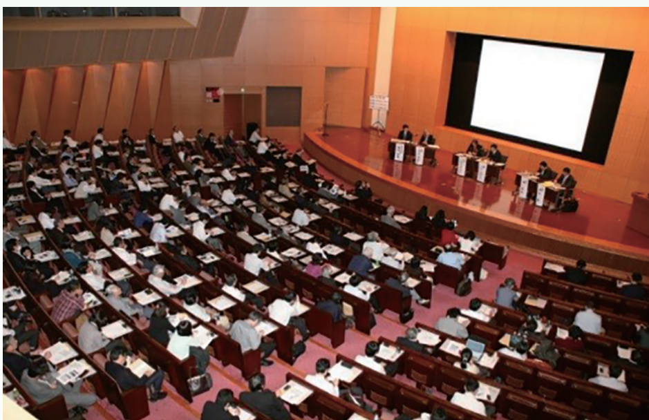
図3 第1回悪意の商標出願セミナーの講演