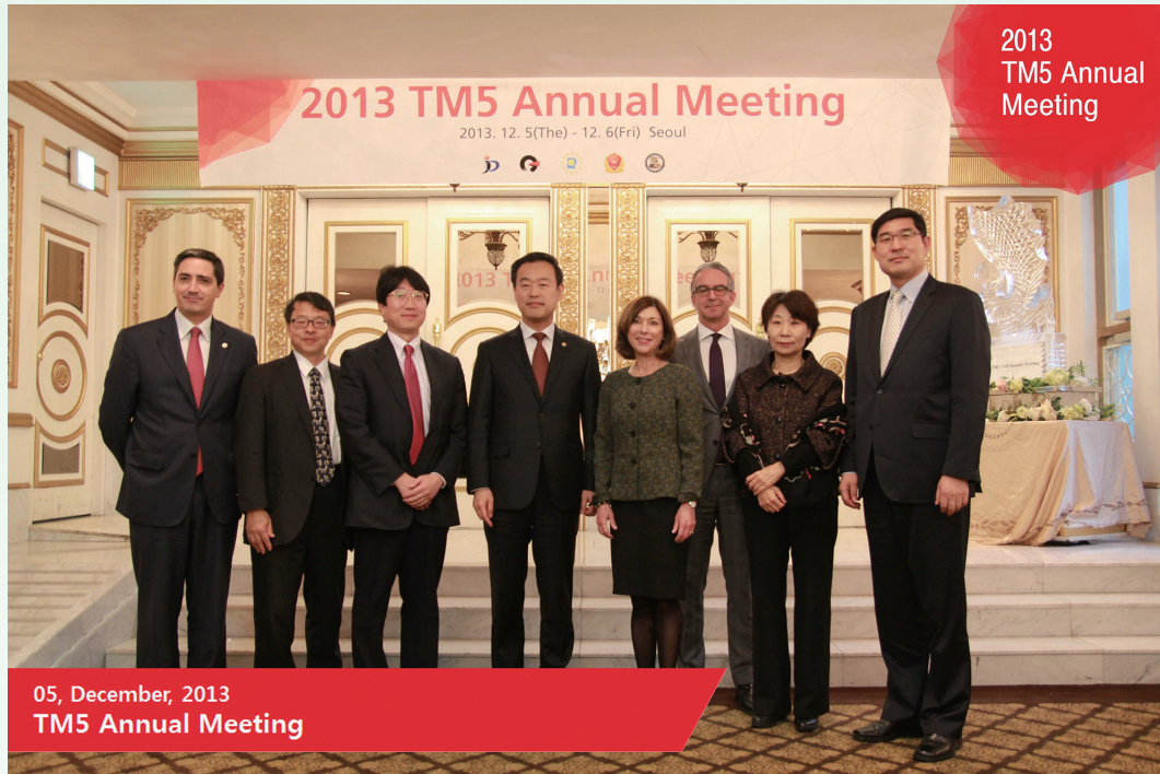
図1 第2回商標五庁（TM5）年次会合（於ソウル）