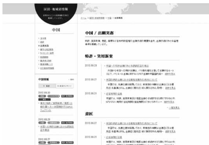
図3 中国／出願実務ページ

コンテンツはさらに法律ごとにも分類しており、上の画面でも、「特許・実用新案」、「意匠」、「商標」、その他という分類に従い、コンテンツを新しい順にそれぞれ最大3件表示するようにしている。さらに「一覧を見る」をクリックすることにより、法律別のコンテンツの一覧を見ることができる。