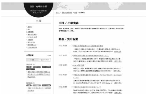
図4 中国／出願実務 特許・実用新案一覧ページ

また、コンテンツのそれぞれにキーワードを付与しており、サイト上でキーワード検索及び全文検索を可能としている。検索はサイト上部のキーワード検索欄に単語を打ち込むことでも検索できるが、サイト中央部の「情報を検索する」の部分において、国・地域やカテゴリーを選択してその範囲に絞って検索をすることもできる。