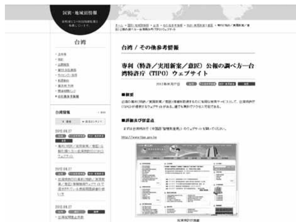
図6 特許公報の調べ方—台湾

このような特許情報等の検索関連コンテンツの例として、「専利（特許／実用新案／意匠）公報の調べ方—中国特許庁（SIPO）ウェブサイト 3 」や「韓国の判例の調べ方 4 」などもある。このようなコンテンツは、カテゴリーとしては各国の「その他参考情報」の中に分類されているが、「調べ方」等のキーワードを用いて検索することも可能である。