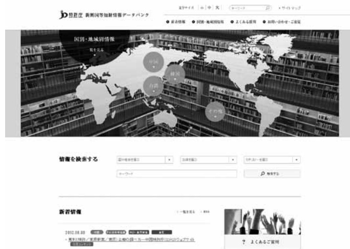
図2 新興国等知財情報データバンクトップページ